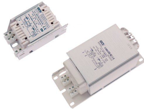
Format 2 Formato 2